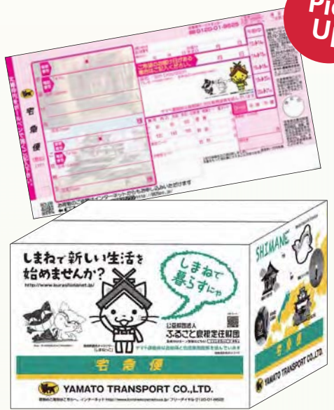
島根県オリジナルデザインご当地送り状と宅急便BOX