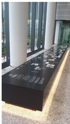
キューブを手に取りながらヤマトグループの歴史を学べる『100THANKS』

「羽田 CG 見学コース」では、宅急便の仕組みやヤマトグループの歴史、またグループ全体で推進する「バリュー・ネットワーキング」構想の内容を、実際に「見て」「聞いて」「触って」「体験して」いただくための5つのアトラクションをご用意しており、無料でご見学いただけます。（予約制）