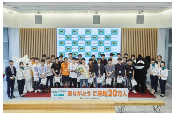
法政大学理工学部の皆様