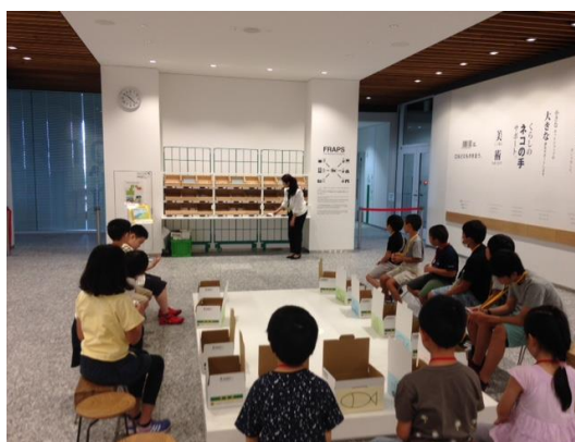
お子様向け体験イベントの様子

また、小学生のお子様を対象として、宅急便の流れや仕分けについての仕組みを体験しながら学ぶイベントを定期的で開催しています。