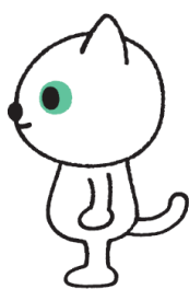
横向きのクロネコ・シロネコ