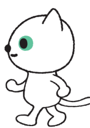
歩くクロネコ・シロネコ