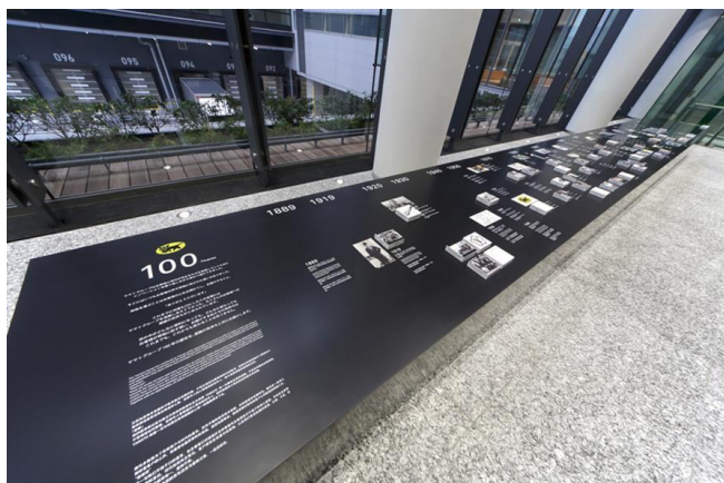
ヤマトグループの歩みを学べる『100THANKS』

両見学コースには、オープン以来、日本国内のみならず、海外からも多くのお客様にご来場いただき、「羽田 CG 見学コース」は、2019年9月16日（月）に来場者数が20万人を突破、また「関西 GW 見学コース」は、これまでに2万人超のお客様にご来場いただきました。