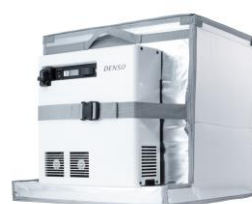
断熱箱と組み合わせた状態

近年の電子商取引市場の拡大にともない、食品や医薬品など、温度管理を必要とする配送のニーズが増加しています。また、企業向けの冷蔵・冷凍品の小口多頻度配送需要も高まりつつあります。その一方で、配送にドライアイスを使用する車両も多く、より環境にやさしい配送が求められています。