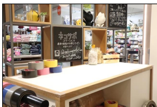
出品・梱包エリア