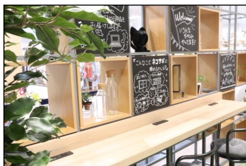
ワーキングエリア