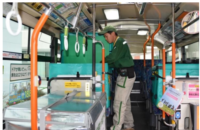
宅急便を積み込む様子 (手前がクール宅急便、奥が常温の宅急便)