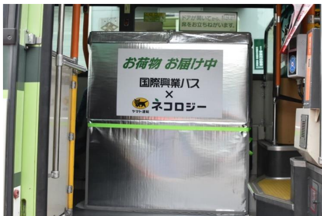
オリジナルクールボックス (縦 600mm×横 1100mm×高さ 1200mm)

左から、ヤマトグループキャラクター「シロネコ」、ヤマト運輸 片山支社長、飯能市 大久保市長、 埼玉運輸支局 森下支局長、国際興業 南社長、ヤマトグループキャラクター「クロネコ」