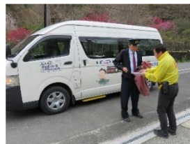
郵袋を村営バスに積載