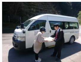
村営バスにヤマト運輸 の荷物を積載