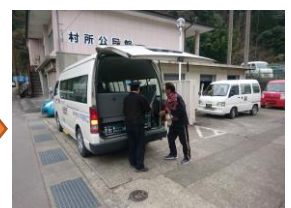
郵便局員が郵袋を受取り、 輸送完了