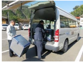
小川へ運ぶ荷物を積載