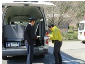
村の委託配達員が 荷物を受取り