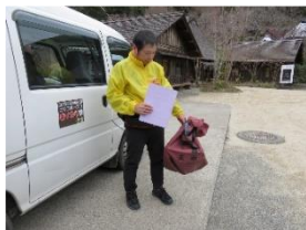
地区の郵便ポストから収集 した郵便物を郵袋に収納