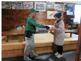
ヤマト運輸の荷物を 受取り、一時保管