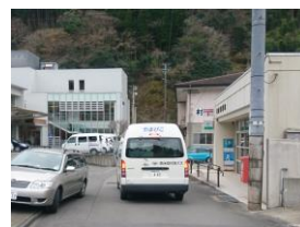
村営バスが郵便局前に 到着